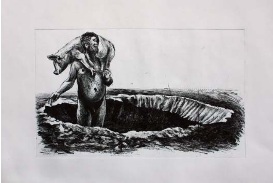
« CYCLOPE NAVIGATEUR DE CRATÈRES » - 2016, gravure imprimée sur papier 50 X 35 cm.