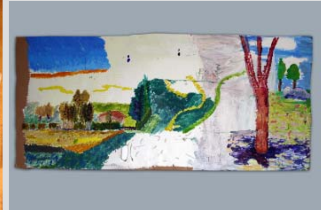
Travaux d'élèves issus de l'atelier « DE L'IDÉE DU PAYSAGE EN RE-PRÉSENTATION » animé par Pascal Poirot