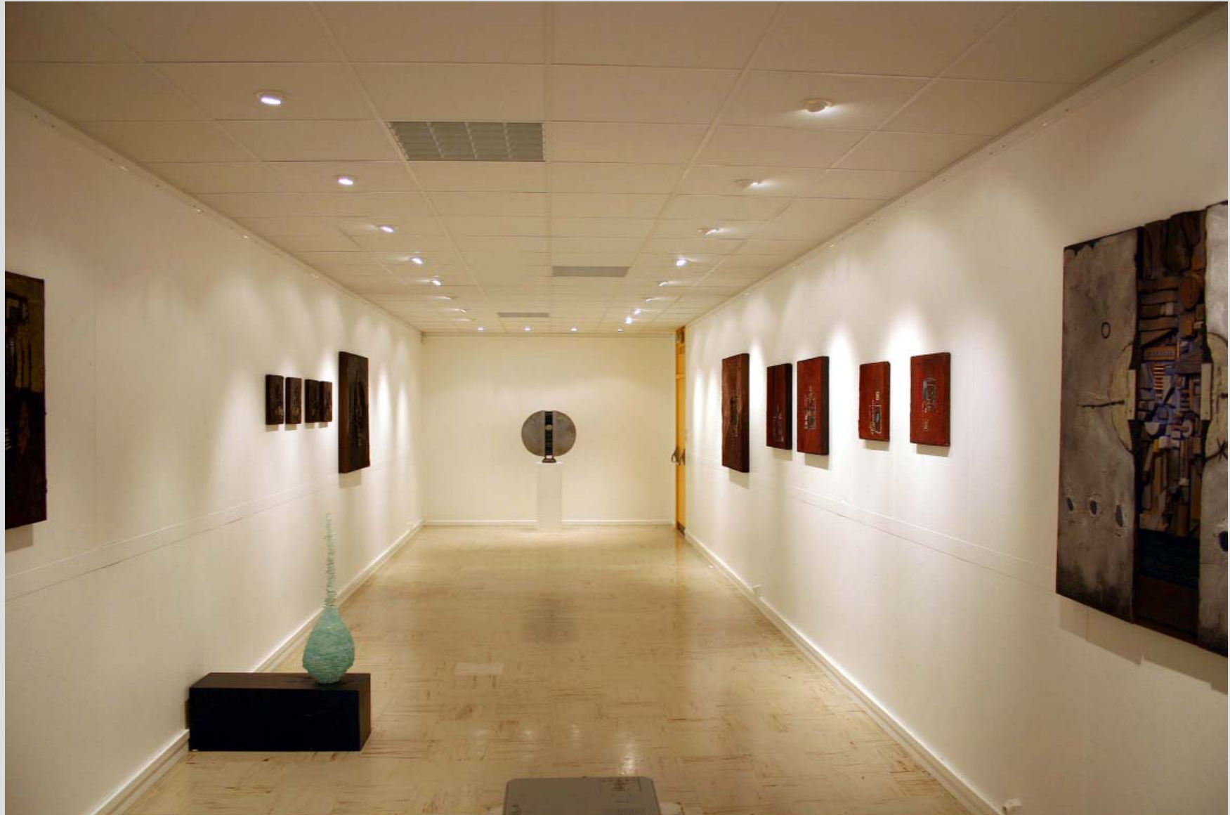
« LE FRAGMENT ET LE TOUT » de Bruno Fœglé