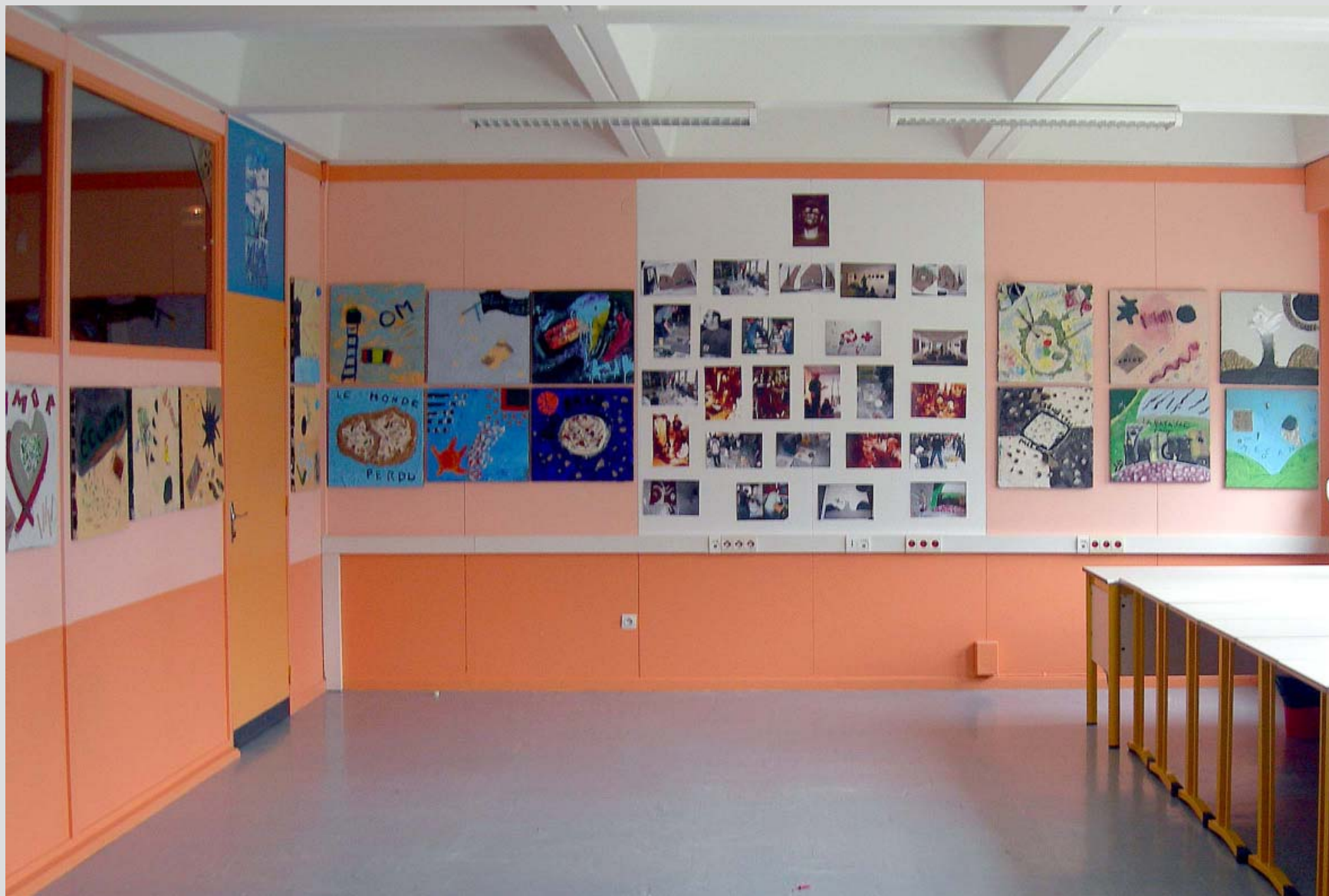
Exposition des élèves : « LA MATIÈRE DES MOTS » sous la direction de Bruno Fœglé