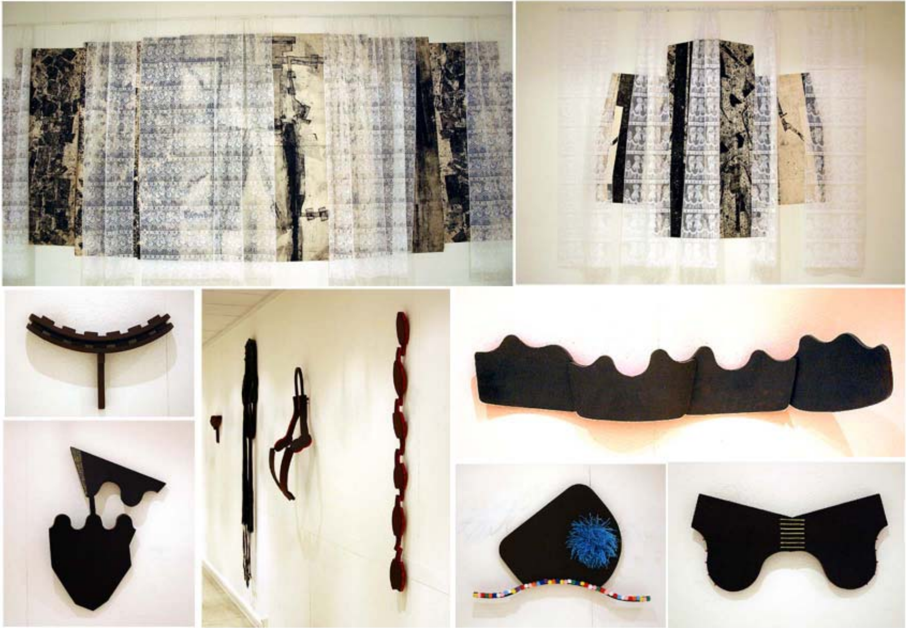
DIFFÉRENTES VUES DE L'EXPOSITION «ENTRE LES CILS» DE VINCENT GAGLIARDI DANS LA SALLE GEORGES DE LA TOUR