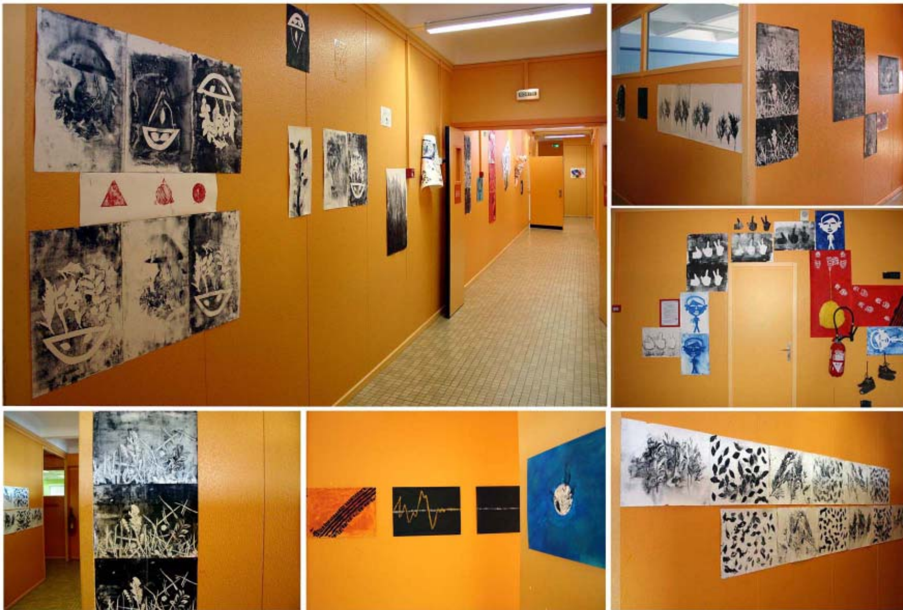
EXPOSITION : «LA TRACE DE L'EMPREINTE» DE LA CLASSE DE TROISIÈME C AUTOUR DE LA SALLE GEORGES DE LA TOUR