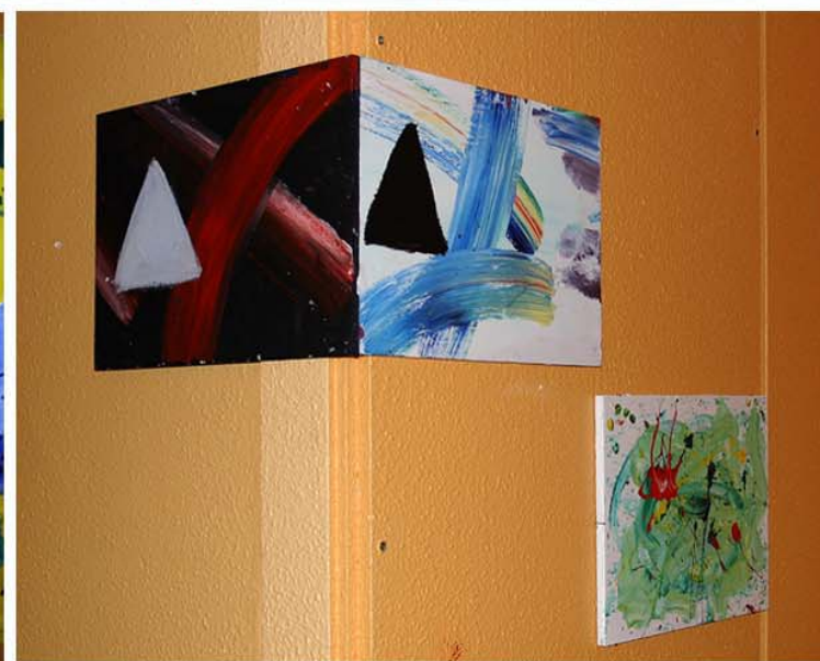
EXPOSITION : «MONDES» DE LA CLASSE DE TROISIÈME B AUTOUR DE LA SALLE GEORGES DE LA TOUR