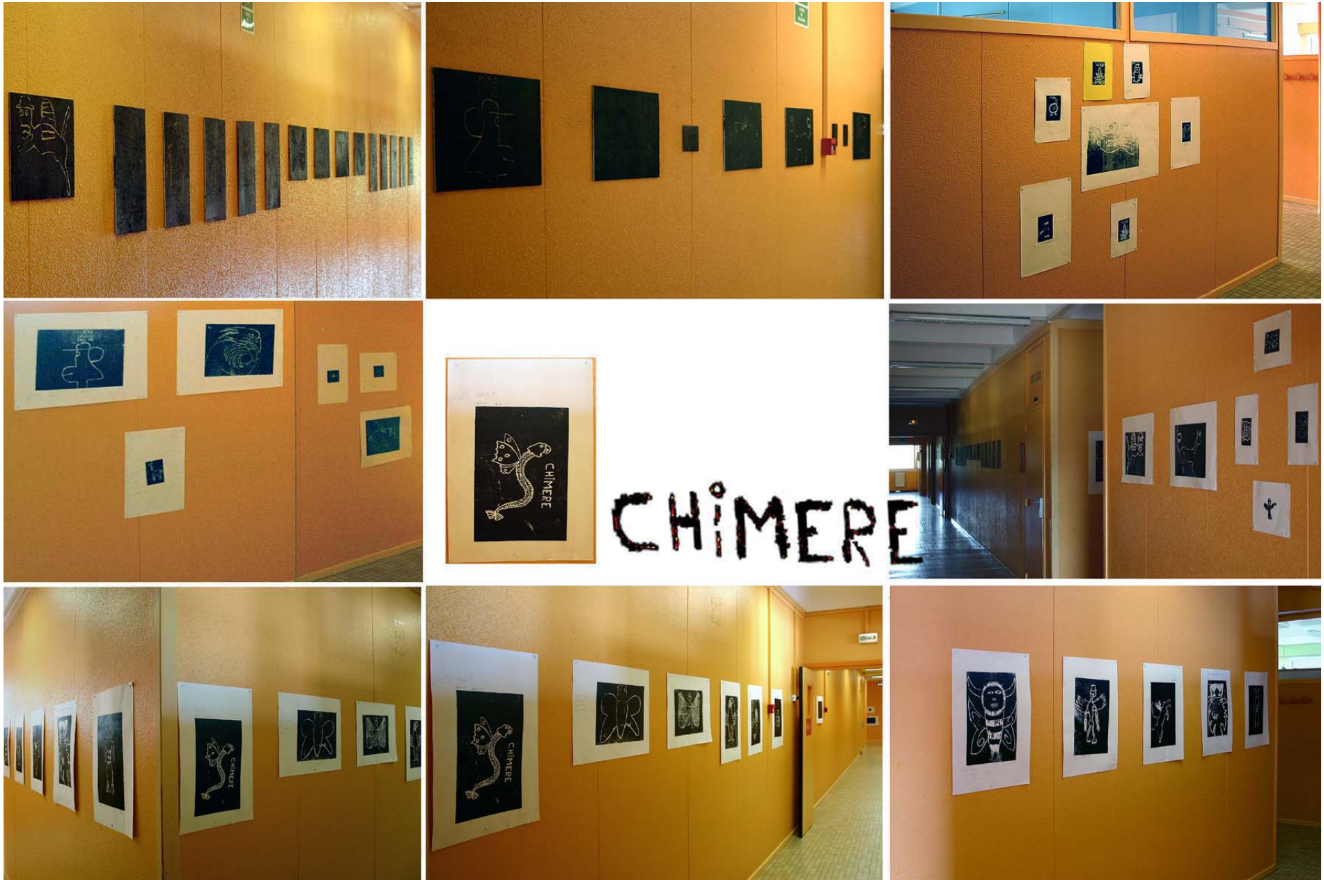
L'EXPOSITION : «CHIMÈRE / GRAVURES SUR BOIS» SUITE À L'ATELIER ANIMÉ PAR DAMIEN DEROUBAIX AVEC LA CLASSE DE TROISIÈME B