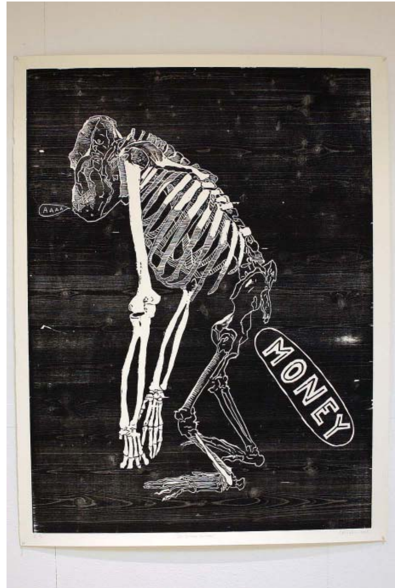
DIFFÉRENTES VUES DE L'EXPOSITION «ROOTS» DE DAMIEN DEROUBAIX DANS LA SALLE GEORGES DE LA TOUR